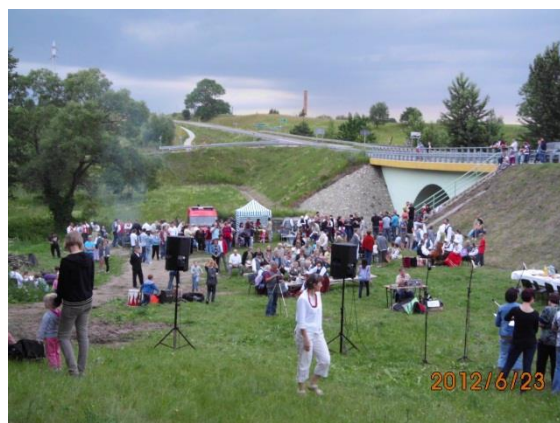
Imprezy plenerowe organizowane na terenie biblioteki.