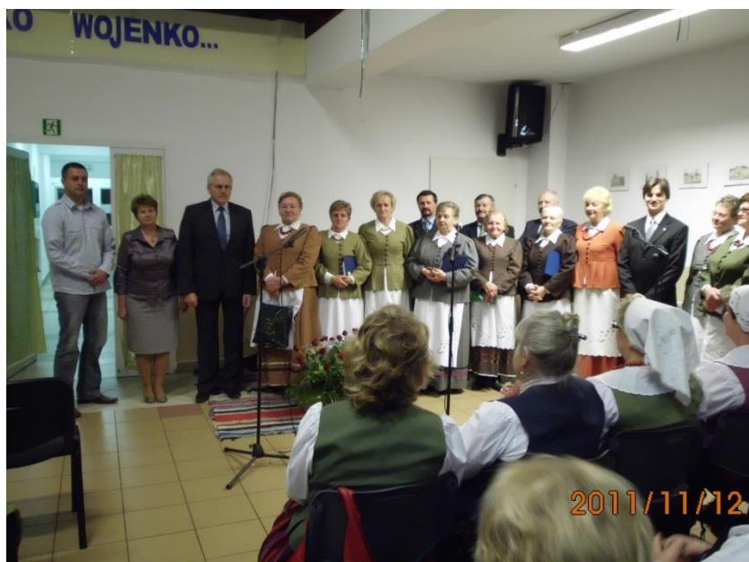
Zespoły ludowe działające na terenie gminy wraz z władzą gminną i biblioteczną.