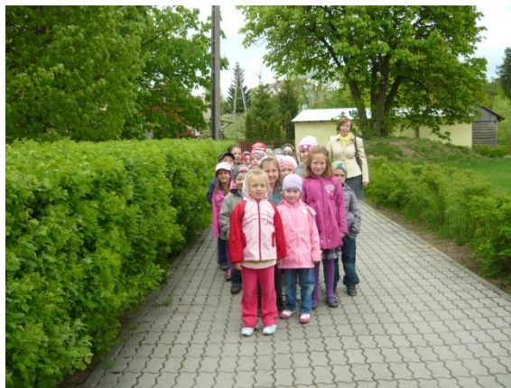
Wizyta dzieci w bibliotece