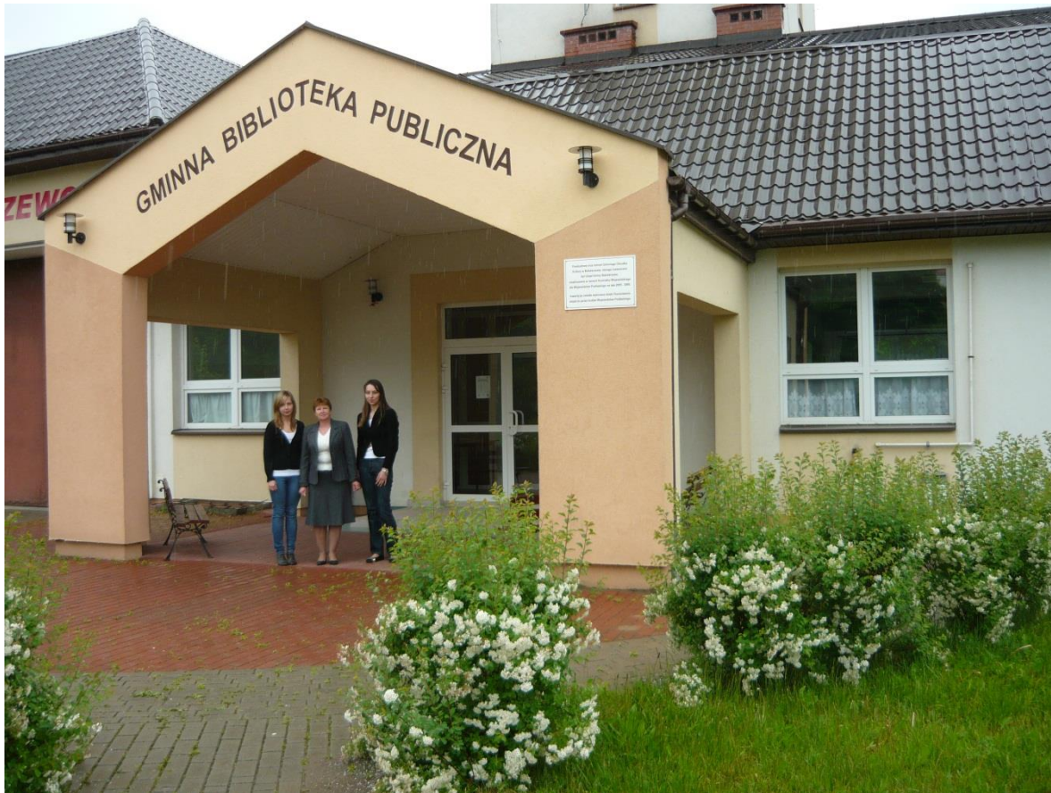
Obecny budynek G.B.P. w Bakałarzewie po generalnym remoncie przeprowadzonym w 2005 roku wraz z kadrą biblioteczną.